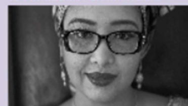
Djaïli Amadou Amal

En partenariat avec la Fondation Jan Michalski