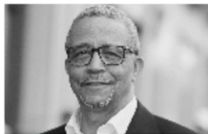
Yasmina Khadra